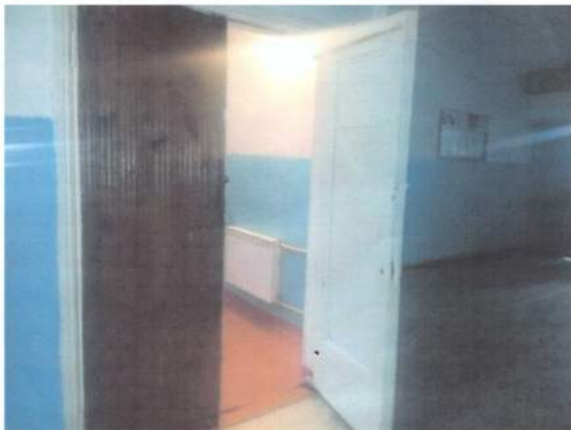
Выход с лестницы на 2 этаже